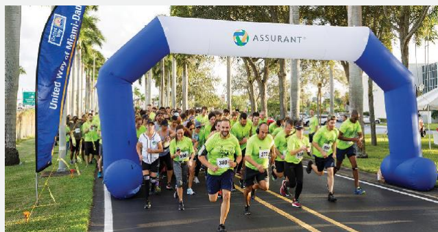
Em todo o mundo, funcionários voluntários ajudam as comunidades onde vivem e trabalham. Na foto a Corrida Assurant 5K para beneficiar a United Way of Miami-Dade que já arrecadou quase US$ 450.000 desde 2016.

Bom senso, decência comum, pensamento criativo e resultados excepcionais guiam a forma como apoiamos nossos clientes e trabalhamos juntos.