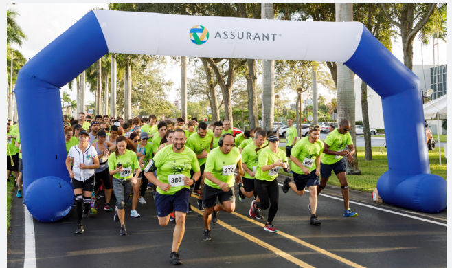
Partout dans le monde, des employés s'offrent volontairement pour aider les communautés où ils vivent et travaillent. Depuis 2016, notre événement annuel Assurant 5K au profit de United Way of Miami-Dade a permis de récolter près de 450 000 USD.

Bon sens, décence élémentaire, un raisonnement atypique et des résultats hors du commun guident notre manière d'assister nos clients et de collaborer.